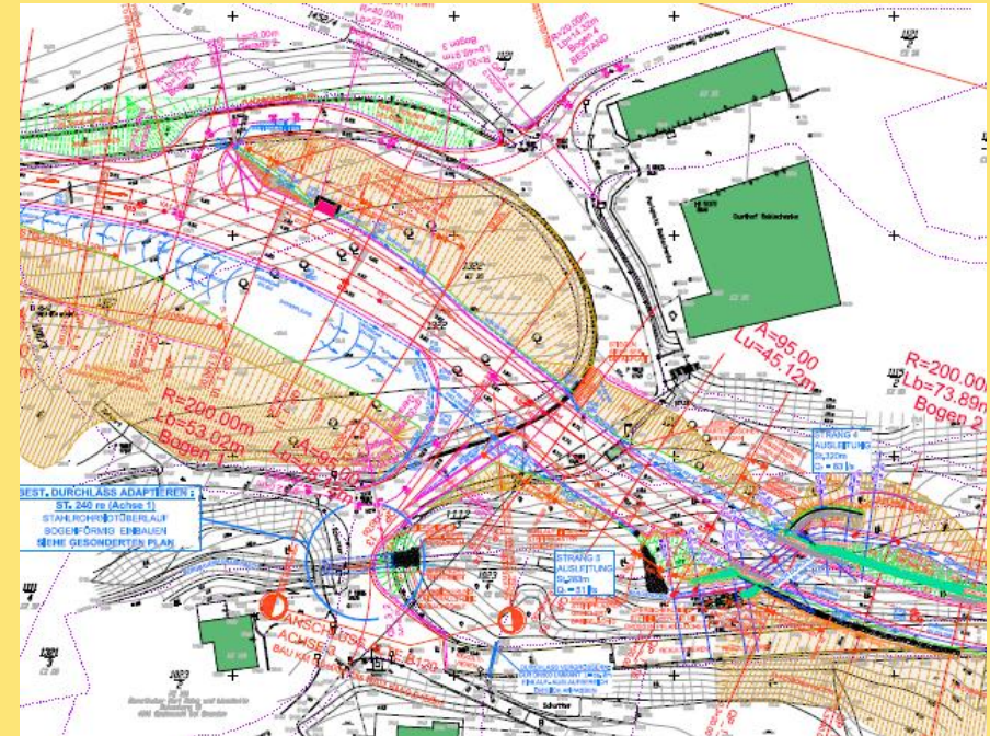
(Abb.: Lageplanauszug Bereich Gasthaus Rablschenke)