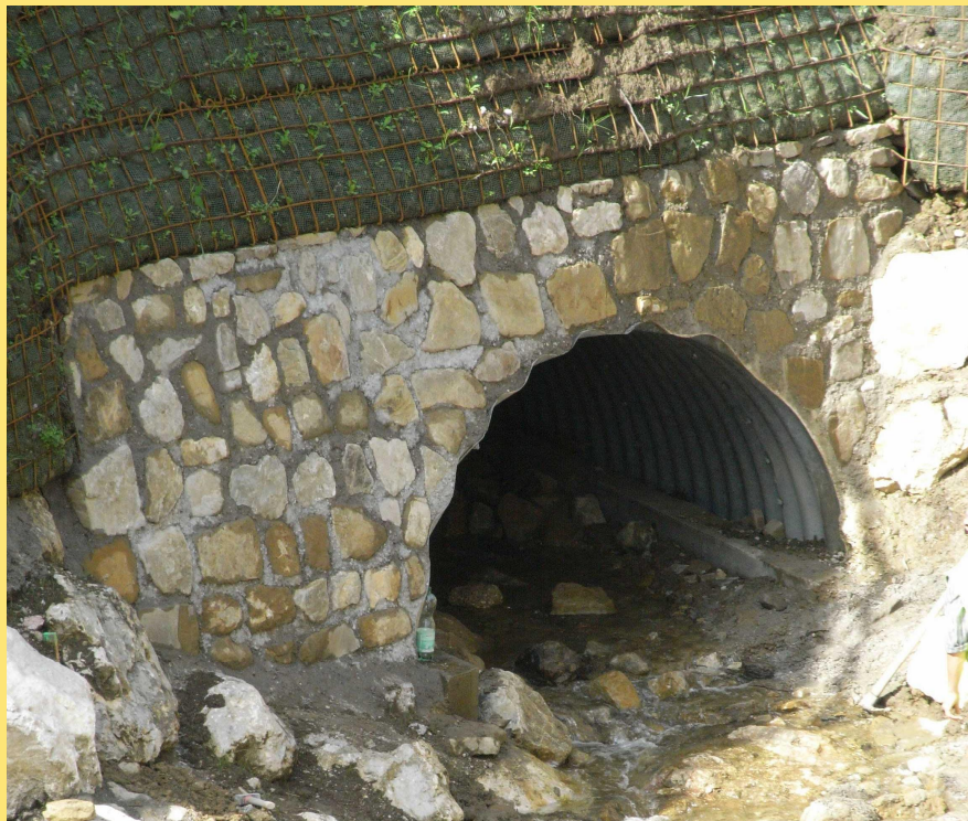
(Abb.: Fertiggestellter Bachdurchlass)