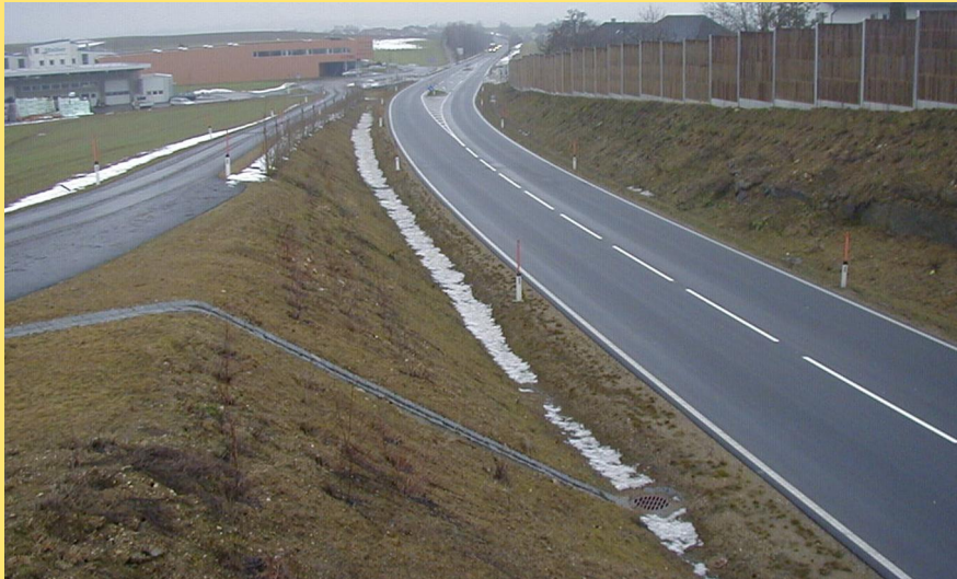
(Abb.: Umfahrung Arnreit Süd)

Somit wurde entschieden, die 1,4 km lange Umfahrung Arnreit im Zuge der B 127, Rohrbacher Straße zu errichten und somit den Ortskern vom Durchzugsverkehr zu entlasten.