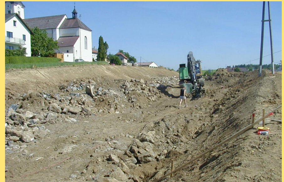
(Abb.: Felsabtrag Bereich Kirche)

Die neue Trasse der B 127, Rohrbacher Straße, wird von Linz aus kommend in östlicher Richtung vor der Ortschaft Arnreit rechts am Ort vorbeigeführt. Der Höhenrücken hinter der Kirche wird dabei eingeschnitten und führt in Folge wieder zum Bestand.