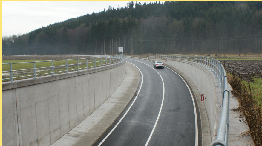
(Abb.: Asphaltierte Fahrbahn Ende November 2011)

Die Gesamtfertigstellung des Bauvorhabens erfolgte Ende November 2011.