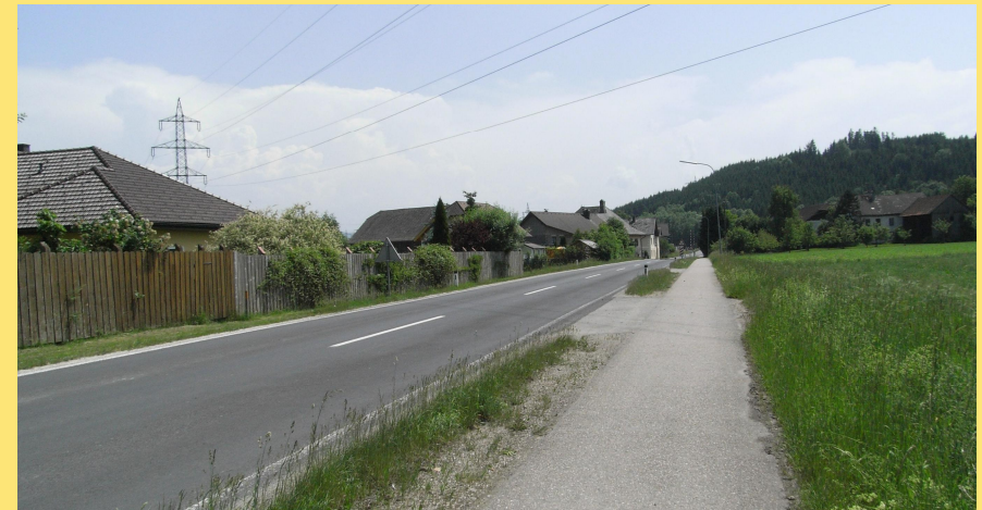
(Abb.: Bereich der Einmündung in den Bestand)

Seit dem die ÖBB-Westbahnstrecke zu einer Hochleistungsstrecke ausgebaut wurde bzw. wird, nimmt der Bahnverkehr und die damit verbundenen Wartezeiten an niveaugleichen Bahnübergängen mehr und mehr zu, da die Intervalle zwischen den einzelnen Fahrten immer kürzer werden. Durch die Errichtung eines Unterführungsbauwerkes wird diese Gefahrenstelle nunmehr ausgeschaltet.