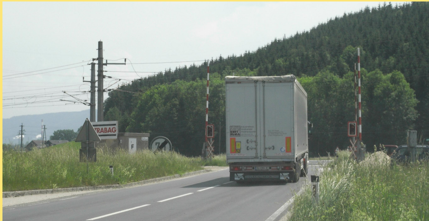
(Abb.: bestehende Eisenbahnquerung)

Zur Zeit quert die L1271 Jochlinger Straße im Bereich der Ortschaft Stöfling niveaugleich die ÖBB-Westbahnstrecke und verläuft in weiterer Folge durch die Ortschaft Stöfling. Um die bestehende Eisenbahnkreuzung auflösen zu können, welche eine Gefahrenstelle darstellt, und gleichzeitig die Ortschaft Stöfling vom starken Schwerverkehrsaufkommen zu entlasten, wurde gemeinsam mit den ÖBB die Errichtung einer Bahnunterführung in Angriff genommen.